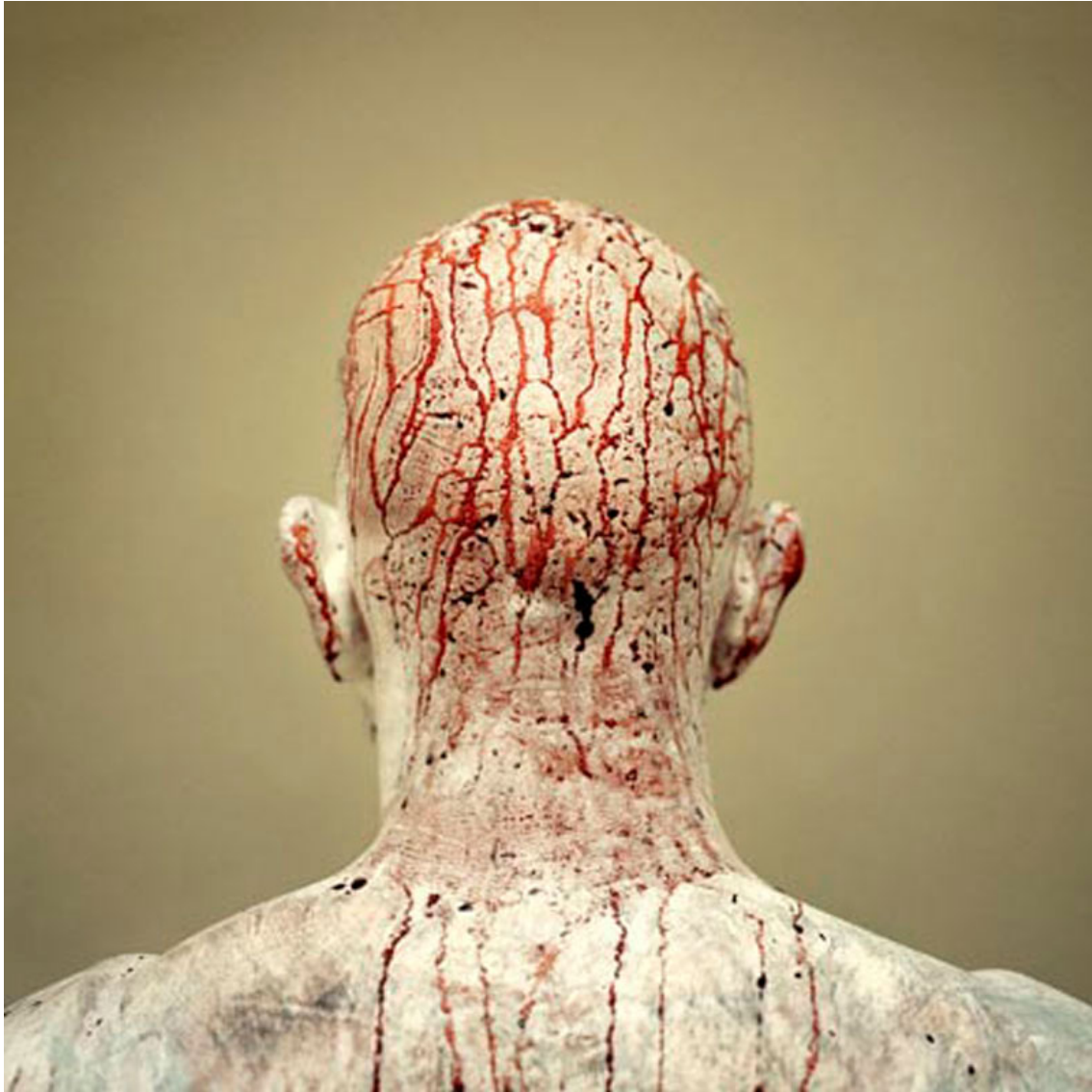
Aktion 398 p. Manuel Vason - Fonte Immagini: www.franko-b.com

Franko B si è trasferito a Londra dall'Italia nel 1979: ha studiato belle arti al Camberwell College of Arts nel 1986-87, al Chelsea College of Art nel 1987-90 e alla Byam Shaw School of Art nel 1990-91. Riconosciuto a livello internazionale, utilizza nel suo lavoro disegno, installazioni, scultura e performance. Ha lavorato con molte istituzioni come la Tate Modern, Tate Britain, Tate Liverpool, l'ICA, il Palais des Beaux-Arts Belgio, Ex Teresa Mexico City, PAC Milano, RU ARTS Mosca e molte altre. Il suo lavoro è presente in molte collezioni pubbliche e private, tra cui la Tate Permanent Collection, il V&A Museum, la collezione permanente della città di Milano. Ha tenuto lecture alla St Martins School of Art, DasArt, New York University and the Courtauld Institute of Art, e al Royal College of Art a Londra. Il suo lavoro è stato recentemente oggetto di tre monografie. È professore di scultura all'Accademia di Belle Arti di Macerata dal 2009.